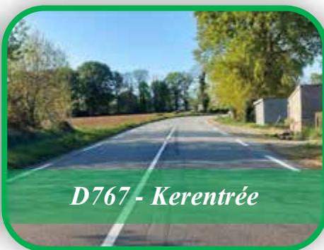
D767 - Kerentrée