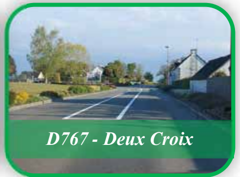
D767 - Deux Croix

Les élus neulliacois ont retenu l'entreprise Helios Atlantique pour un montant de 4 957 € HT pour réaliser les marquages au sol de la rue de Bellevue et de la D767 à l'intérieur de l'agglomération. Elle est aussi intervenue pour refaire la peinture de passages piétons importants ou très effacés ainsi que le parking de la garderie pour un montant de 866,50 € HT.