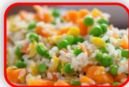
RIZ CANTONNAIS SAUCE LENTILLES