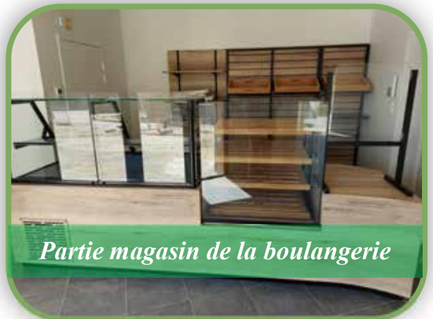
Partie magasin de la boulangerie

Nous comptons sur les habitants pour leur réserver un bon accueil dans notre commune et pour venir goûter régulièrement pains, viennoiseries et pâtisseries proposés.