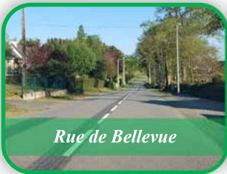
Rue de Bellevue