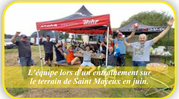
L'équipe lors d'un entraînement sur le terrain de Saint Mayeux en juin.