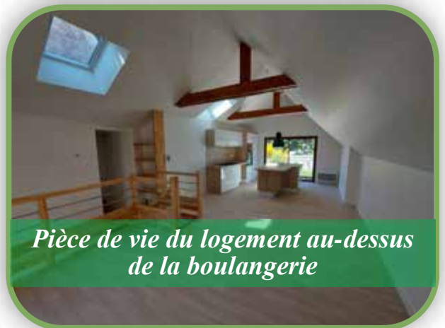
Pièce de vie du logement au-dessus de la boulangerie