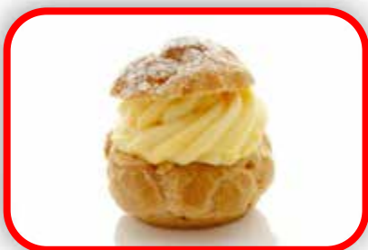
CHOUX À LA CRÈME CITRON