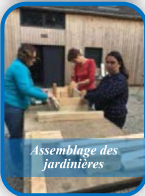
Assemblage des jardinières

Calendrier des animations Octobre : vente de légumes Samedi 3 décembre : marché de Noël