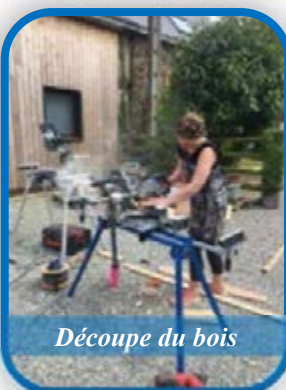
Découpe du bois