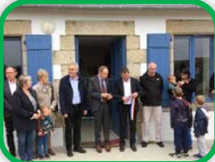
Samedi 14 octobre 2018 : Inauguration de la maison éclusière d'Auquinian

Merci au vendeurs de pain ! L'amicale des retraités vend régulièrement du pain sur commande lors de la fermeture de l'EDEN. Les bénévoles ont été reçus en mairie le samedi 27 octobre pour un apéritif convivial afin de les remercier et de saluer leur disponibilité.