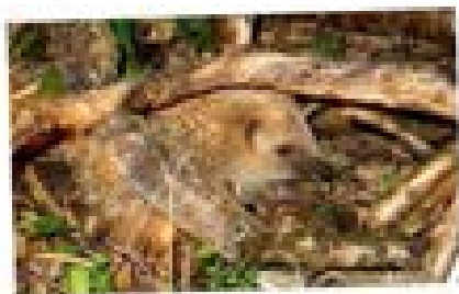
Un hérisson à l'entrée de son gîte

Au cœur d'un tas de bûches de bois, prévoyez une cavité de 45x25x20 cm. Placez une bâche imperméable sur cette cavité, et quelques feuilles mortes au sol. N'oubliez pas l'accès à la chambre ! Choisissez un endroit à l'ombre, au pied d'une haie.